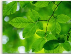
Fotosíntesis A ser un medio para canalizar energía positiva