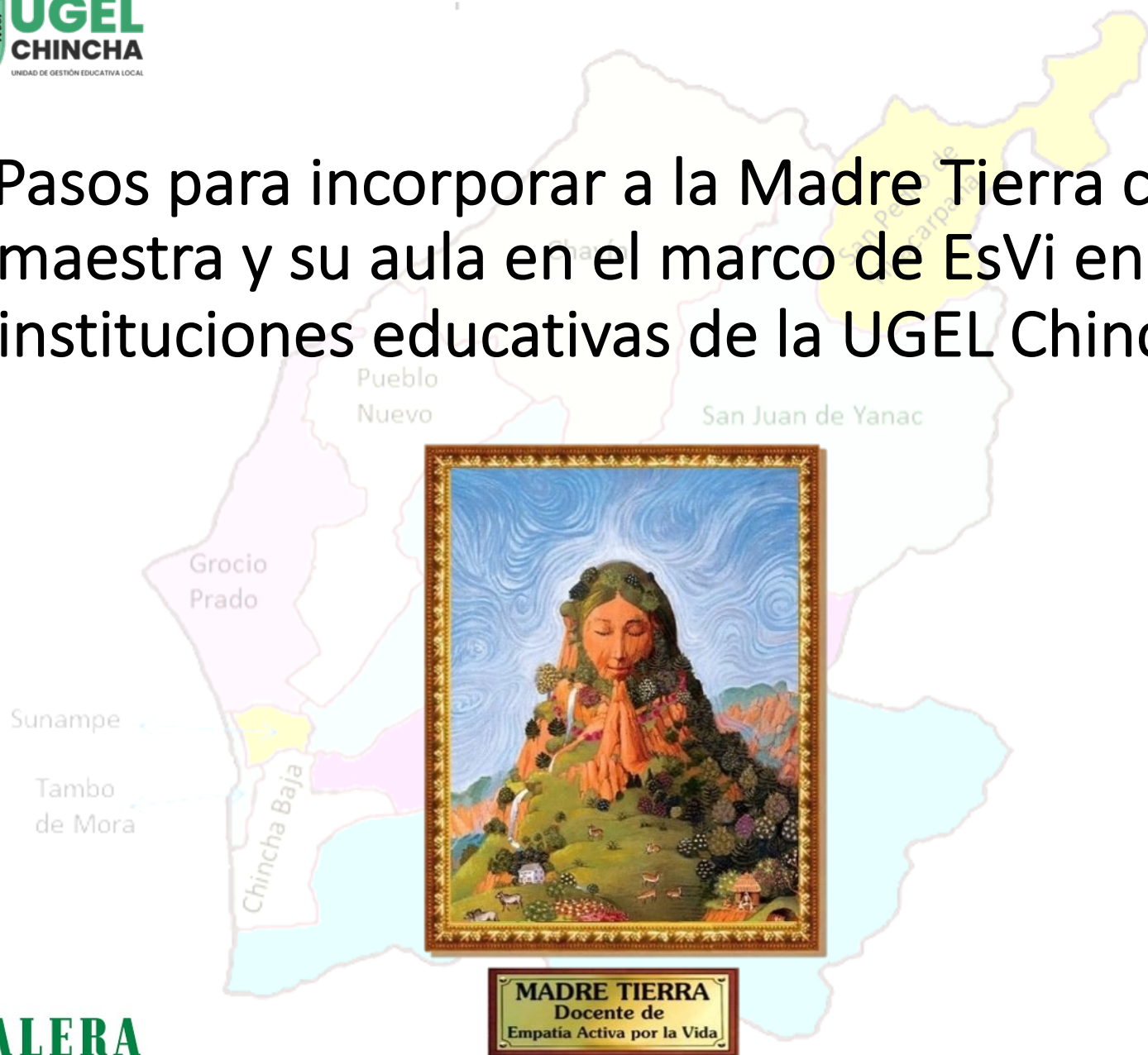
MADRE TIERRA Docente de Empatía Activa por la Vida