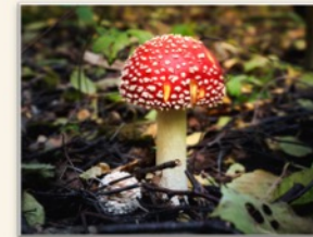
Cero basura A que todo se recicla