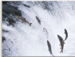
Perseverancia A continuar hasta lograr nuestro objetivo