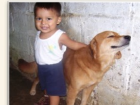
Empatía A sentir lo que el otro siente y aportar a su bienestar