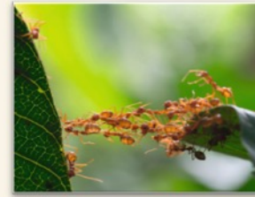
Cooperación A cooperar entre miembros de una misma especie