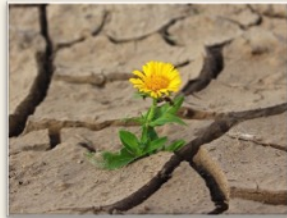
Resiliencia A florecer en la adversidad