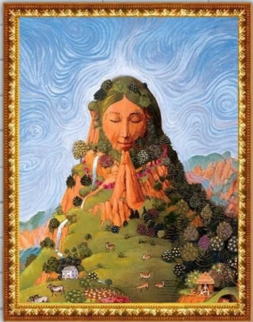
MADRE TIERRA Docente de Empatía Activa por la Vida