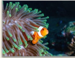
Mutualismo A cooperar entre diferentes especies